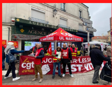
https://taxesuperprofits.fr/ Avec Attac 92 4 décembre