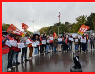
Rassemblement devant la Préfecture de Nanterre en soutien aux raffineurs en grève