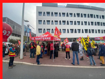
Devant le MEDEF 92 le 27 octobre Manifestation Ile de France Augmenter les salaires pas l'âge de la retraite !