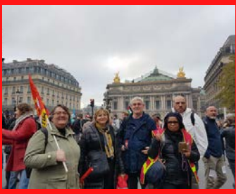
Manifestation 10 novembre