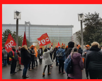
AXA 6 décembre