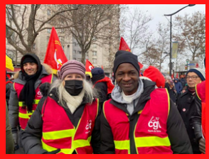
Collectif Migrant-es 18 décembre