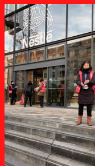
Déploiements Coordination Quai Roosevelt