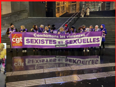
25 novembre à Bastille UD CGT 75 et 92