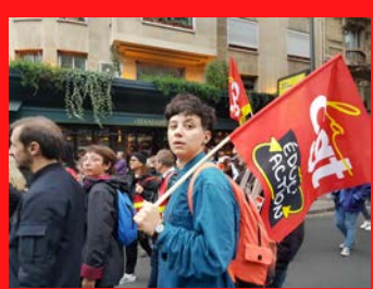
Grève pour les lycées professionnels et grève interprofessionnelle pour les salaires 18 octobre