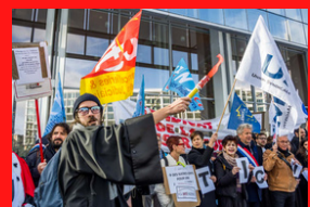
Mobilisation Justice Tribunal Nanterre 22 novembre