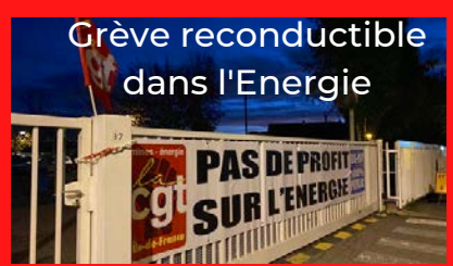
Grève reconductible dans l'Energie