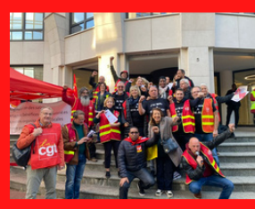
Manifestation pour les salaires Ausy groupe Randstadt avec la CD UGICT