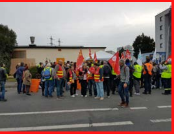
Grève Geodis Gennevilliers Lutte gagnante 25 octobre