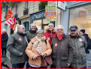
Retraités-es siège du MEDEF 6 décembre