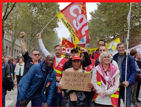
Les salarié-es, privé-es d'emploi, retraité-es en lutte du 92, dans le cortège de l'UD Pour des augmentations de salaire ! 29 septembre