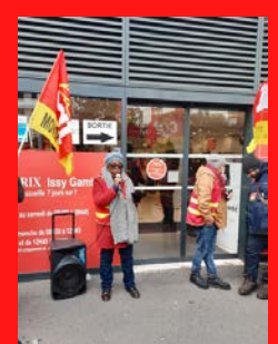
Samedis de la colère : les salarié-es du commerce s'organisent et se mobilisent Carrefour Market Monoprix Cultura Truffaut etc dans tout le département ...