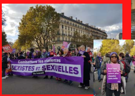
Manifestation 19 novembre contre les violences sexistes et sexuelles