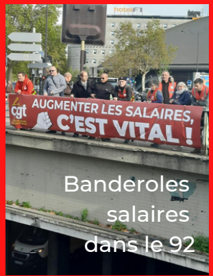
Banderoles salaires dans le 92