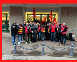
Agents de sécurité vs Action logement